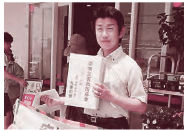
豪雨災害支援募金にとりくむ東市議 (7/19)