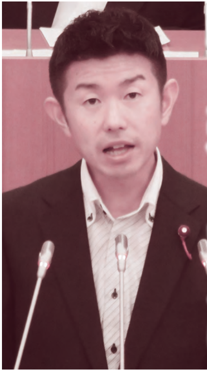
個人質問する東市議 (9/13)