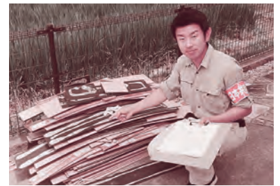
浸水地域で聞き取りや調査を行う東市議 (8/25)