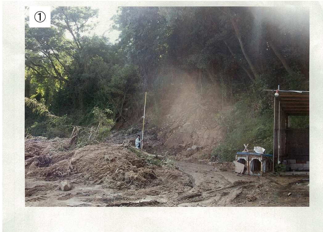
資料4 北区岩井の崩落現場 岡山市の資料より