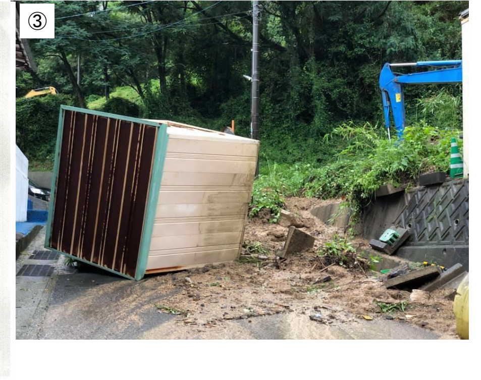
資料5 2018年7月7日住民撮影写真より