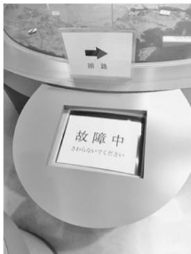
壊れたままの映像展示 (市埋蔵文化財センター)

南区の彦崎貝塚は、縄文時代早期(約1万年前)から晩期(約2800年前)の国指定史跡です。全国的に