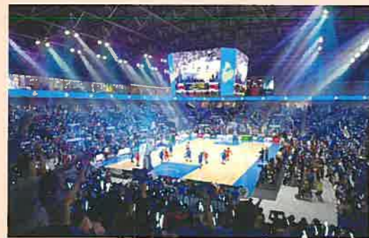
新アリーナの内部のイメージ

大型映像設備やVIP用の特別な部屋（スイート）など、バレーボールやバスケットボールのプロリーグの基準を満たす施設とする計画です。