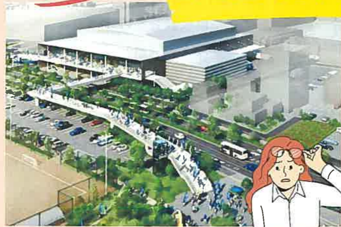
新アリーナとペDESTリアンデッキ(手前側)のイメージ