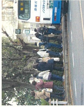
乗車バス停(市営住宅側)