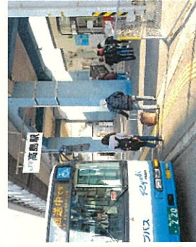
降車バス停(高島駅側)