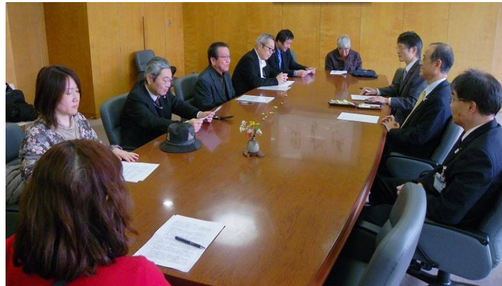
↑2月10日・市民本位の市政をつくる会の代表者と大森市長との懇談会

岡山市長選挙から、早くも一年が経過しました。いま、日本では、安倍内閣の暴走が止まらず、平和と民主主義、日本の経済と国民生活が脅かされています。 こうした時、岡山市民の「防波堤」としての役割を期待されている「岡山市政」。私たちの願いはどこまで到達したのか。みんなで検証したいと思います。