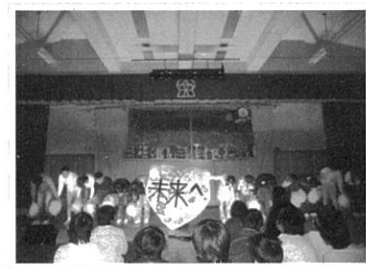
西支援祭（ステージ発表）