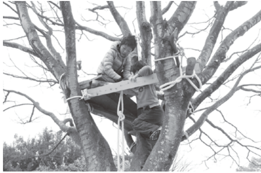
▲プレーパークのリーダー養成などに650万!