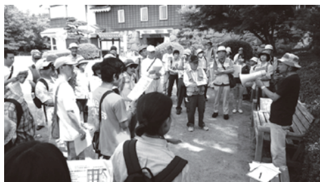
▲岡山市の戦災遺跡めぐり

岡山空襲から70年の節目に市は、追悼式に加え講演会、シンポジウムなどを行うとしています。党市議団は不戦の誓いを伝えるためには、岡山空襲の被害だけでなく、加害を含めて戦争の全体像を伝えることが必要だと求めています。