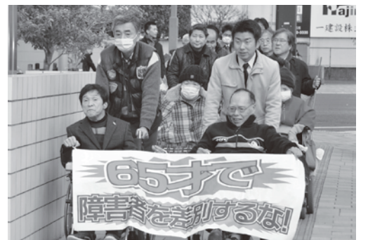
▲65歳問題解決を求める浅田裁判の原告ら