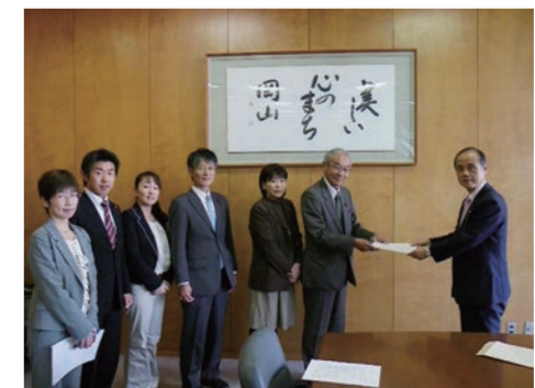
大森市長に提出する党市議団

日本共産党県議団・市議団のアンケートには2500人の方から、切実な要求が寄せられました(上記写真)。こうした願いをまとめて、毎年、予算要求書を提出。その実現に奮闘しています。