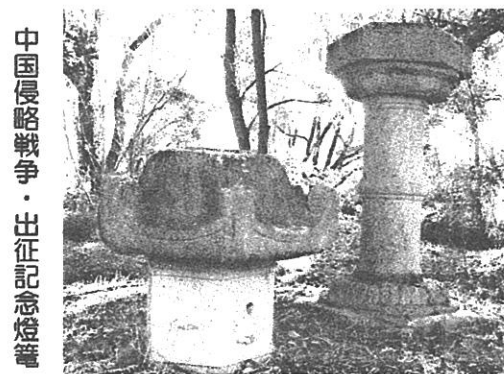
中国侵略戦争・出征記念燈籠

玉井宮・焼け跡が残る狛犬・本殿—浄教寺—大福寺—三勲小学校—伊木家老屋敷長屋門—国清寺—三友寺