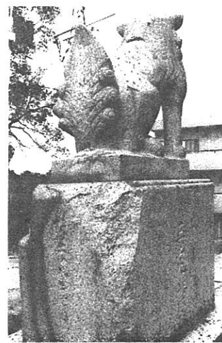
傷跡が残る狛犬と台座

玉井宮・焼け跡が残る狛犬・本殿—浄教寺—大福寺—三勲小学校—伊木家老屋敷長屋門—国清寺—三友寺