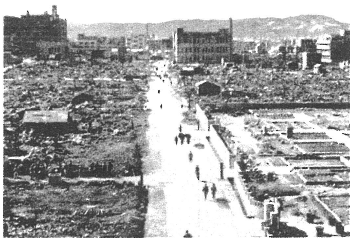
岡山市北区内山下付近にあった岡山市公会堂 (現：岡山県庁)から公会堂筋(県庁通り)を西望。

罹災面積：7.69km 2 (市街地の73%) 罹災戸数：12,693戸 罹災者数：約12万人 死者数：1,737人 負傷者数：6,026人