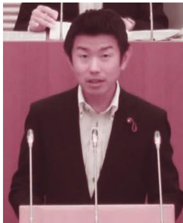
個人質問に立つ東市議(9/6)

原発は動かすかぎり核のゴミが出て、何万年も管理が必要です。原発ゼロこそが必要です。